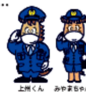
上州くん みやまちゃん